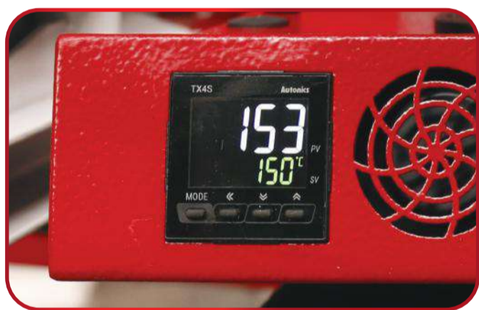
Цифровые регуляторы температуры